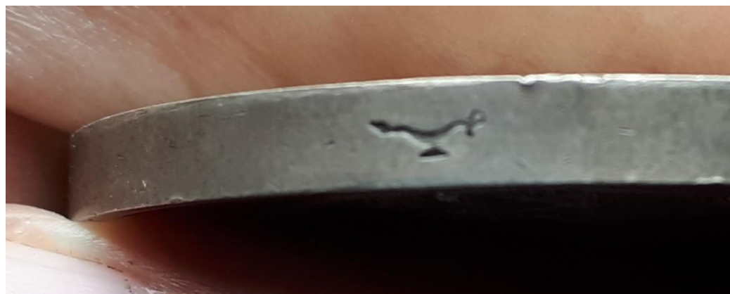
Naslag gemaakt in 1840 voor de reis van Lodewijk Napoleon in Nederland!