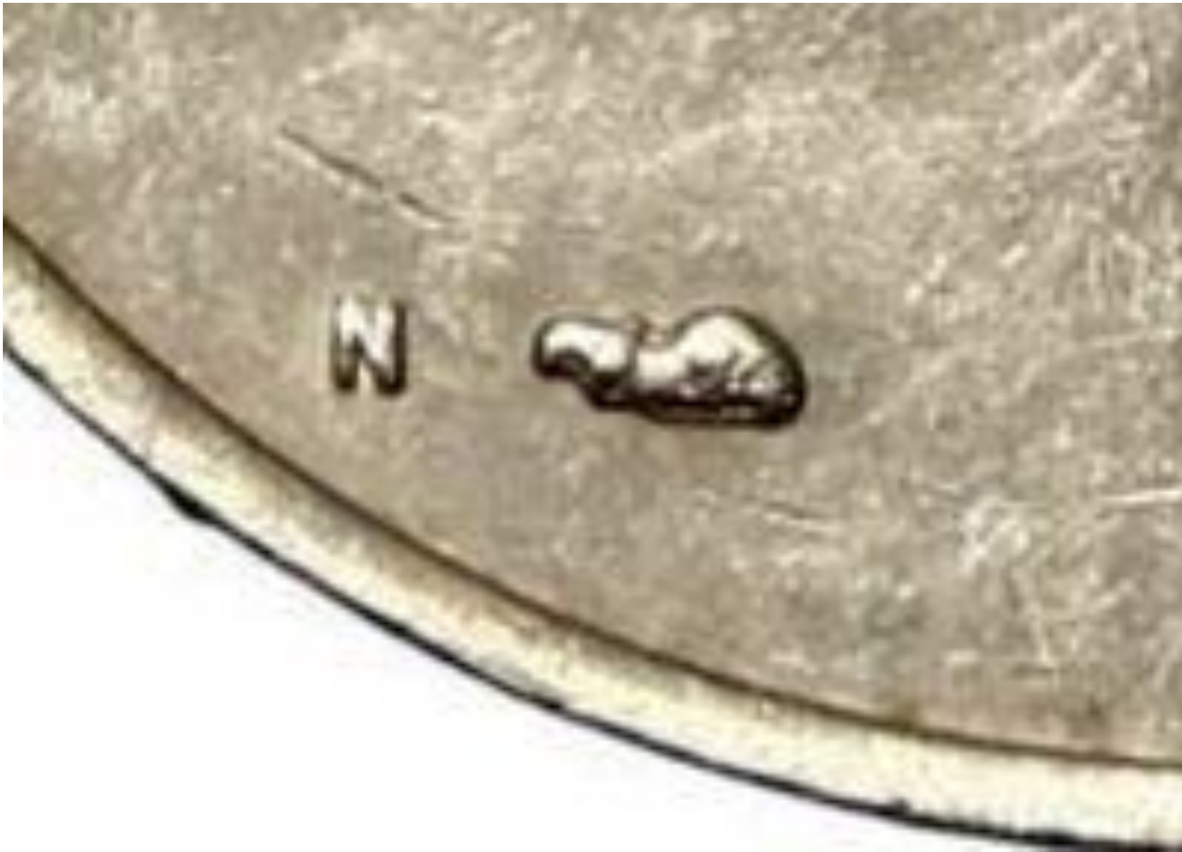
N Hoorn = Nikkel